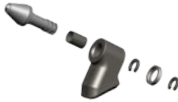
PICCO IN CARBURO DI TUNGSTENO INTERCAMBIABILI PEAK IN TUNGSTEN CARBIDE INTERCHANGEABLE