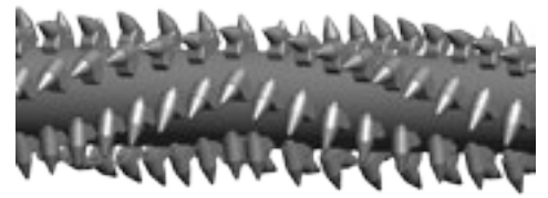
DISPOSIZIONE DEI PICCHI OTTIMALE PER UN'ALTA QUALITÀ DI FRANTUMAZIONE PEAKS WITH OPTIMAL DISPOSITION FOR A HIGH QUALITY CRUSHING