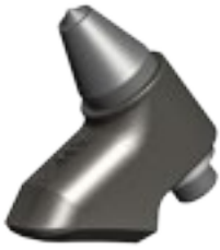
PICCO IN CARBURO DI TUNGSTENO INTERCAMBIABILI PEAK IN TUNGSTEN CARBIDE INTERCHANGEABLE