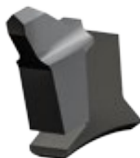
UTENSILE IN CARBURO DI TUNGSTENO INTERCAMBIABILE

TOOL WITH "DOUBLE TEETH" IN TUNGSTEN CARBIDE INTERCHANGEABLE