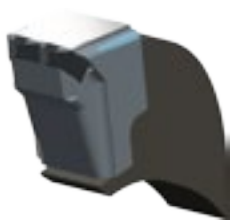
UTENSILE A "DENTE DOPPIO" IN CARBURO DI TUNGSTENO INTERCAMBIABILE

TOOL WITH "DOUBLE TEETH" IN TUNGSTEN CARBIDE INTERCHANGEABLE