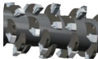
DISPOSIZIONE DEGLI UTENSILI OTTIMALE PER UN'ALTA QUALITÀ DI FRANTUMAZIONE

TOOL IN TUNGSTEN CARBIDE INTERCHANGEABLE